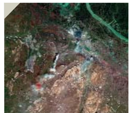
Рис. 3. Классическим образцом данных среднего разрешения являются снимки многоканального сканера ETM+ американского спутника Landsat-7.

В настоящее время на российском рынке представлена продукция крупнейших операторов космических систем ДЗЗ из США, Индии, Канады, Франции и других стран, данные которых охватывают полностью сегменты ми-