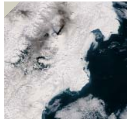
Рис. 6. Применение изображений сканера MODIS для мониторинга вулканической активности на Камчатке. Виден выброс пепла из вулкана Ключевская сопка в марте 2005 г. (черный снег вокруг вулканов связан с предшествующими выбросами пепла). Данные о выбросах пепла используются в международной информационной системе обеспечения безопасности воздушных трасс