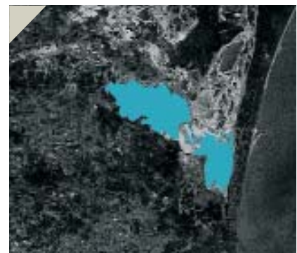
Рис. 7. Радиолокационные изображения среднего разрешения КА RADARSAT-1 успешно используются в России для ледовой разведки, в лесном хозяйстве и гидрологии. Изображение дельты р. Терек (Республика Дагестан) принято с борта КА RADARSAT-1 25 мая 2005 г. по заказу Федерального агентства водных ресурсов МПР России для оценки последствий затопления территорий и планирования работ по ликвидации катастрофического прорыва защитных валов в устье р. Терек. Цветом выделены затопленные районы (изображение обработано специалистами Государственного океанографического института)