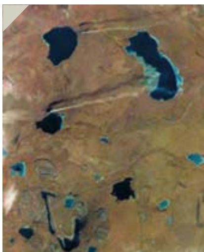
Рис. 4. В России и Казахстане широкое распространение получили данные индийских спутников серии IRS. Снимок промышленных предприятий в Экибастузе, сканер LISS-3, разрешение 23 м, дата съемки 16 ноября 2004 г.