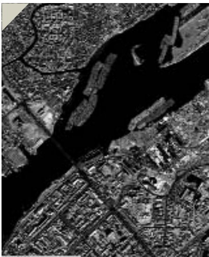
Рис. 1. Пример данных высокого разрешения. В 2005 г. проведен первый летний съемочный сезон КА EROS-A, в результате которого получены изображения крупнейших промышленных центров России. На снимке — г. Архангельск, дата съемки 22 июня 2005 г., разрешение 2 м