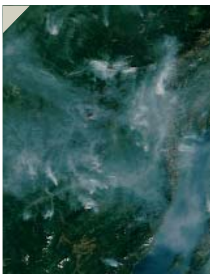
Рис. 5. Изображения низкого разрешения 36-канального спектрорадиометра MODIS спутников Terra и Aqua широко применяются в России в задачах, связанных с ежесуточным мониторингом в масштабе реального времени. Наиболее распространенным практическим приложением данных MODIS является оперативный мониторинг лесных и степных пожаров. На изображении приведены пожары в Прибайкалье в августе 2005 г. Разрешение 250 м. Красные точки — участки, выделенные автоматическим алгоритмом распознавания пожаров

рового рынка космической информации (см. таблицу).